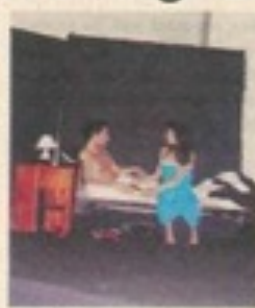
Le théâtre peut mettre en scène des pistes de réflexion.